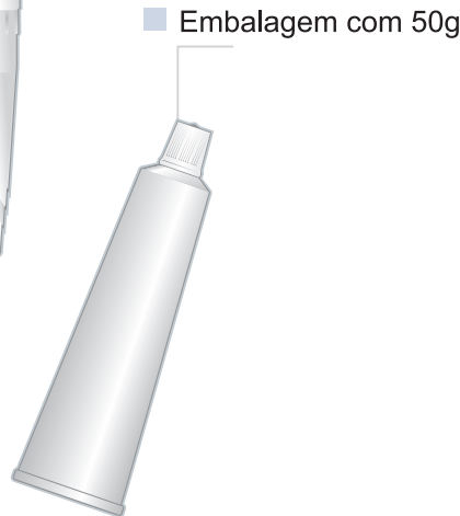
Embalagem com 50g