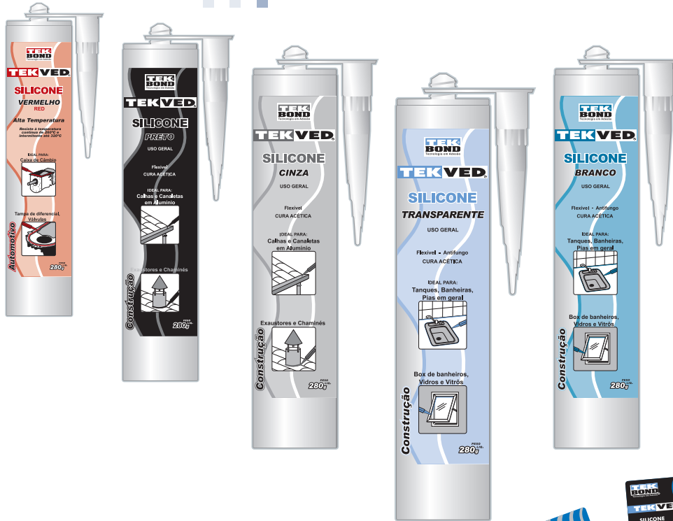
Embalagens com: 280g

Os Adesivos a base de silicone podem ser aplicados tanto na construção civil como na linha automotiva. Suportam altas temperaturas e possuem elasticidade que permite o preenchimento de partes que sofrem dilatações.