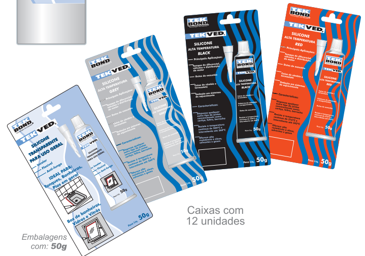
Caixas com 12 unidades