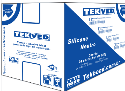
Caixa com 24 unidades