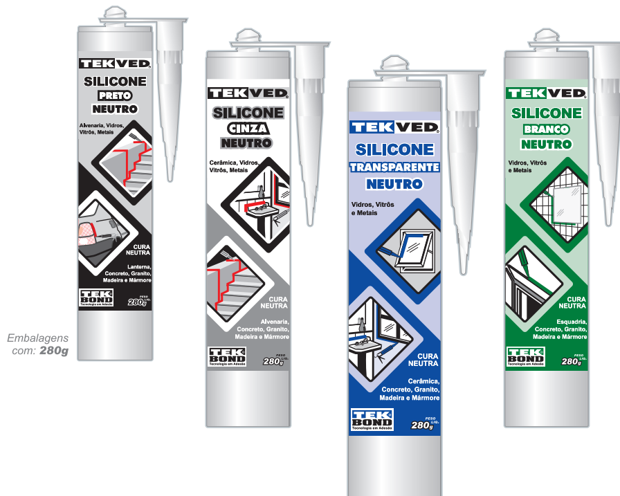
Embalagens com: 280g

Os Adesivos a base de silicone Neutro podem ser aplicados em diversos segmentos, tais como construção civil, indústria moveleira, vidraceira e ferragista. Possuem elasticidade que permite o preenchimento de partes que sofrem dilatações. Não possui Ácido Acético em sua composição, portanto não tem odor e nem danifica superfícies com resinas de vidros laminados e espelhos.